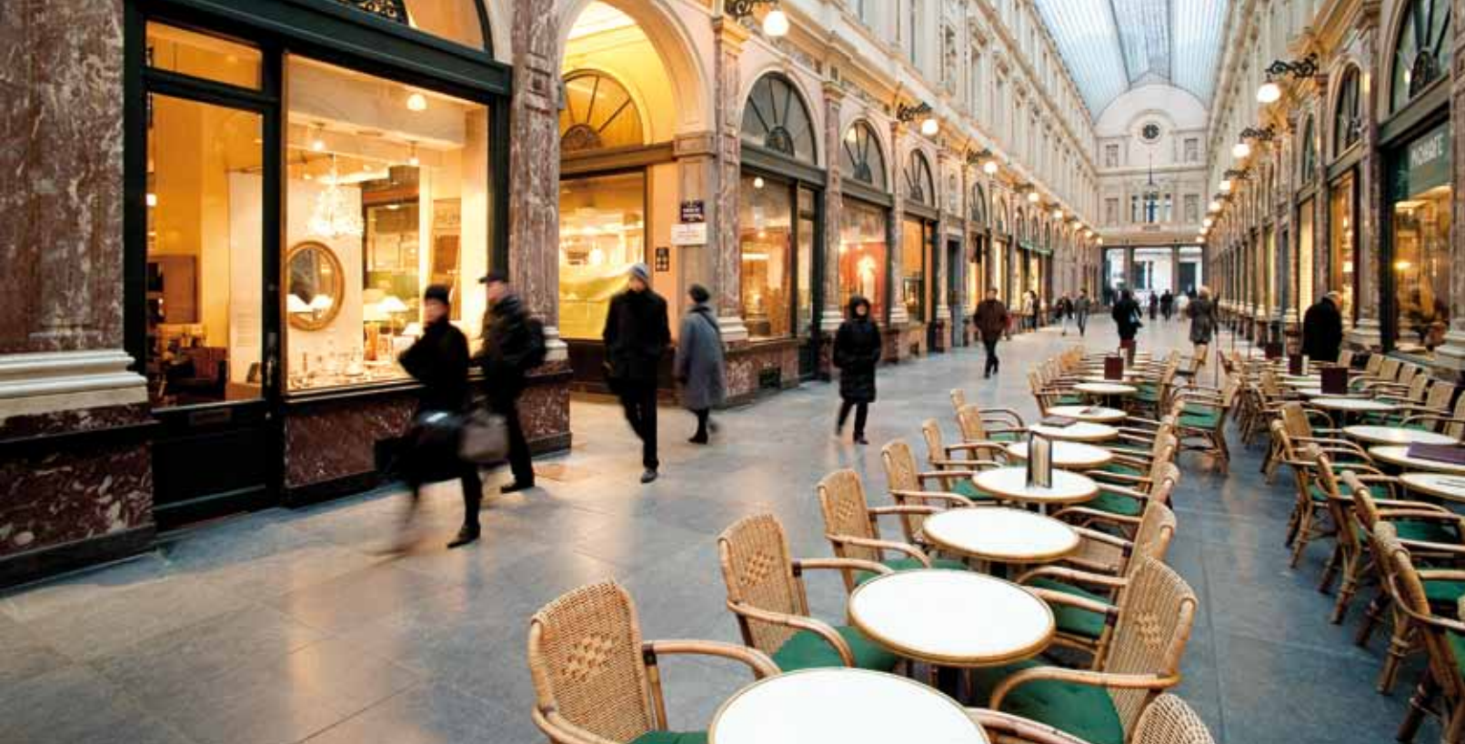
Koninklijke Sint-Hubertusgalerijen

Water: strikte beperking van de onttrekking: het water dat gebruikt wordt voor het zagen van de steen wordt dankzij een gesloten circuit gedecanteerd alvorens het opnieuw in het systeem te brengen. Het water dat in de steengroeve wordt gepompt om toegang te krijgen tot de ertslaag, wordt nadien in het oppervlaktewater geloosd, waardoor de kwaliteit van dat water alleen maar wordt verhoogd. Dankzij een samenwerkingsverband met de Waalse watermaatschappij, wordt het opwellende grondwater of bemalingswater tijdens de ontginning in Tellier des Prés bovendien drinkbaar gemaakt en op die manier gevaloriseerd ten behoeve van de (openbare en industriële) distributiecircuiten.