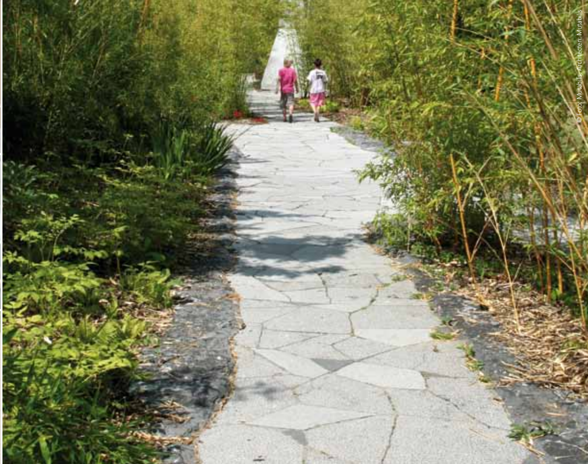
Jardin des Géants in Lille.

Een milieuvriendelijk product: een product dat over zijn hele levensduur een geringere impact heeft op het milieu en tijdens het gebruik zijn kwaliteiten behoudt.